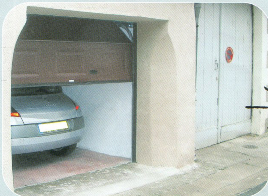
Modèle avec portillon intégré.